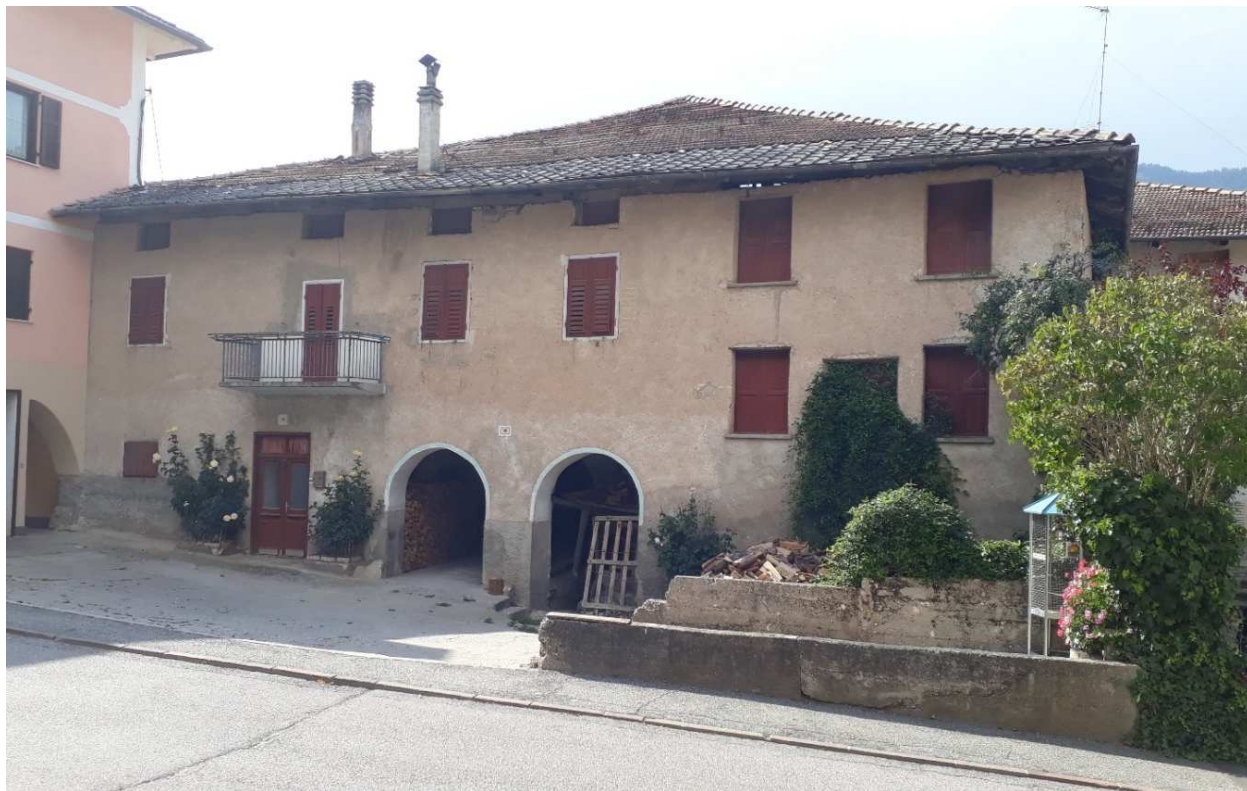
Vista da est